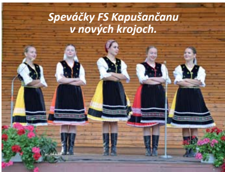
Speváčky FS Kapušančanu v nových krojoch.

Po vystúpení sme oslovili ešte vedúceho FS Kapušančan o zhodnotenie podujatia z pozície účinkujúceho. Jeho vlastnými slovami: „ Atmosféra bola výborná, tešili sme sa a všetci sme to vnímali ako jedinečné vystúpenie, pretože toho roku kvôli Covidu-19 je jediné tohto druhu...keďže sme zvyknutí častejšie vystupovať. Túto sezónu sme mali mať 11 vystúpení a zúčastniť sa dvoch me-