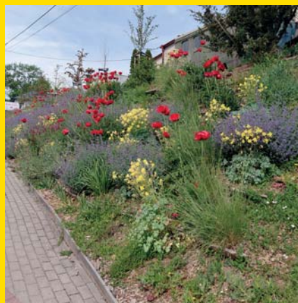
Výsledok komunitnej spolupráce zamestnancov obecného úradu a seniorov na ul. Požiarnická v plnej kráse