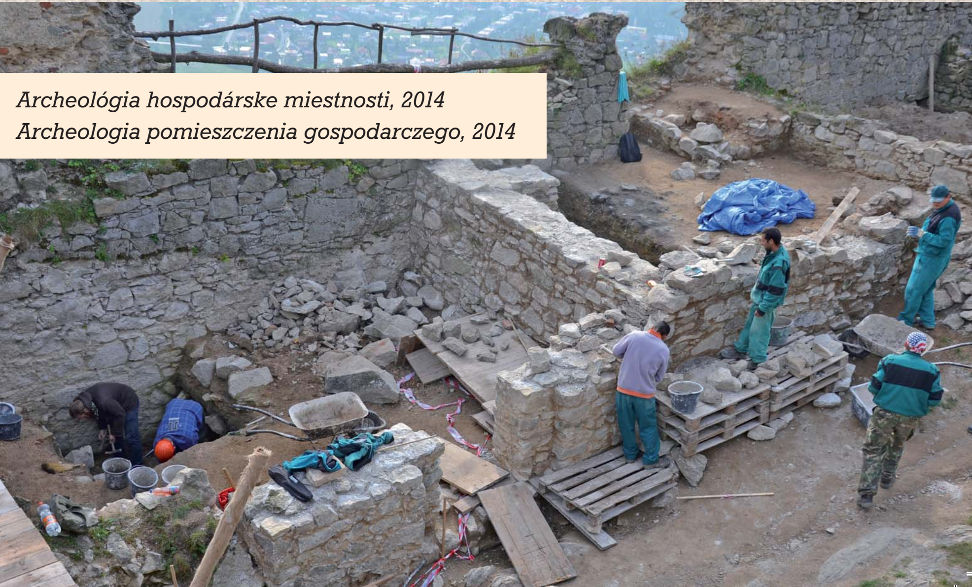
Archeológia hospodárske miestnosti, 2014 Archeologia pomieszczenia gospodarczego, 2014

Projekt Bohatier z Maglovca nr. INT/EK/PO/1/III/A/0245 współfinansowany przez Unię Europejską z Europejskiego Funduszu Rozwoju Regionalnego w ramach Programu Współpracy Transgranicznej Polska - Republika Słowacka 2014-2020.