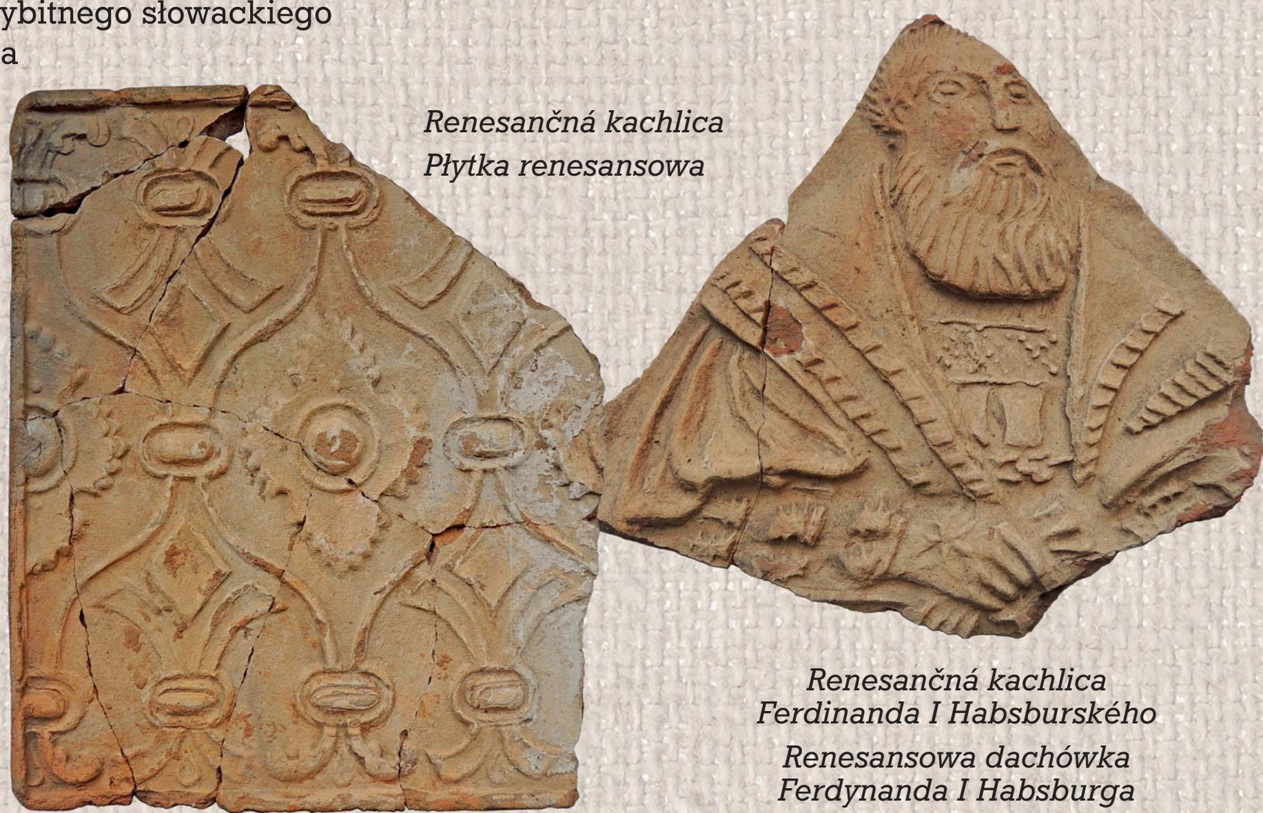
Renesančná kachlica Ferdinanda I Habsburského Renesansowa dachówka Ferdynanda I Habsburga