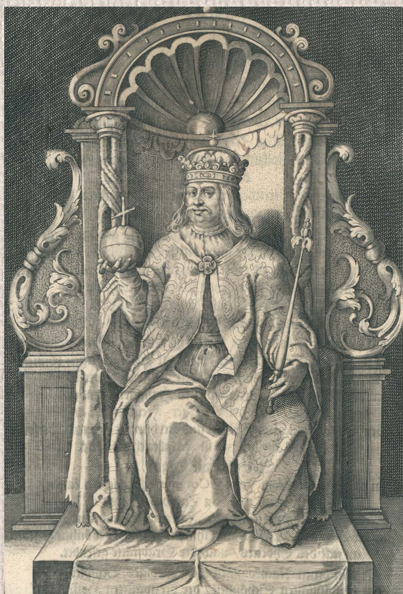
VLADISLAVS I Polonus, XXXIII REX HVNG.