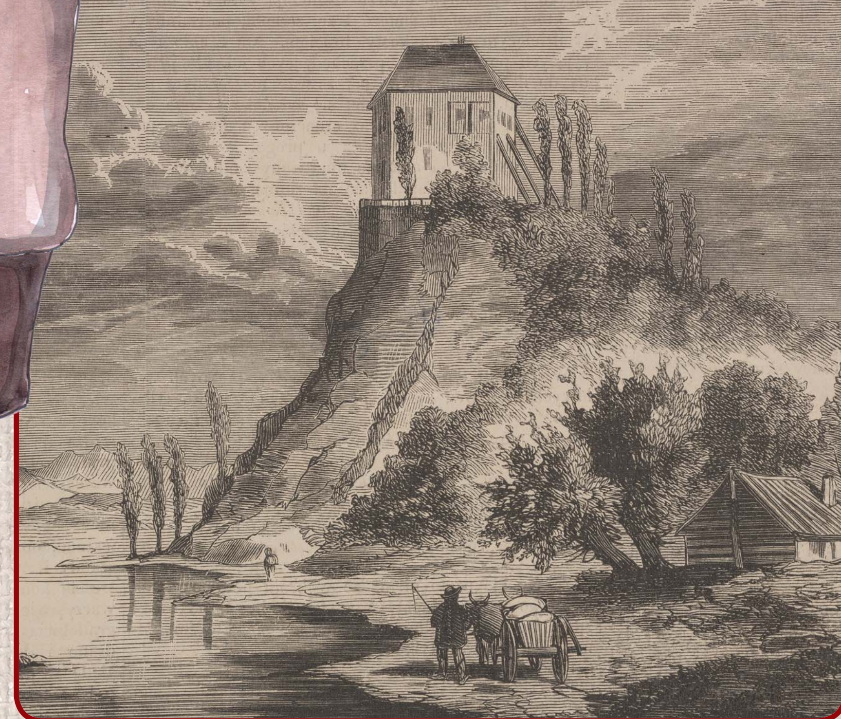
Zamek Królewski, Sanok

Była to opłata za przeprawę towaru i przejście osób pobieraną w wyznaczonych miejscach, między innymi w Kapuszanach. Po drugiej stronie obecnej granicy leży Sanok, miasto partnerskie naszego projektu. Tamtejszy zamek strzegł szlaku prowadzącego na Węgry. W połowie XIV wieku wzniesiono tam średniowieczną twierdzę na pozostałościach wcześniejszego zamku. W XVI wieku zamek przebudowano w stylu renesansowym, a następnie wielokrotnie remontowano i zmieniano jego kształt, aż do uzyskania obecnej postaci. Aktualnie mieści się w nim Muzeum Historyczne. Zamek w Kapuszanach przez wiele stuleci, aż do XVIII wieku, pełnił funkcję strażniczą i obronną, ale o tym później.