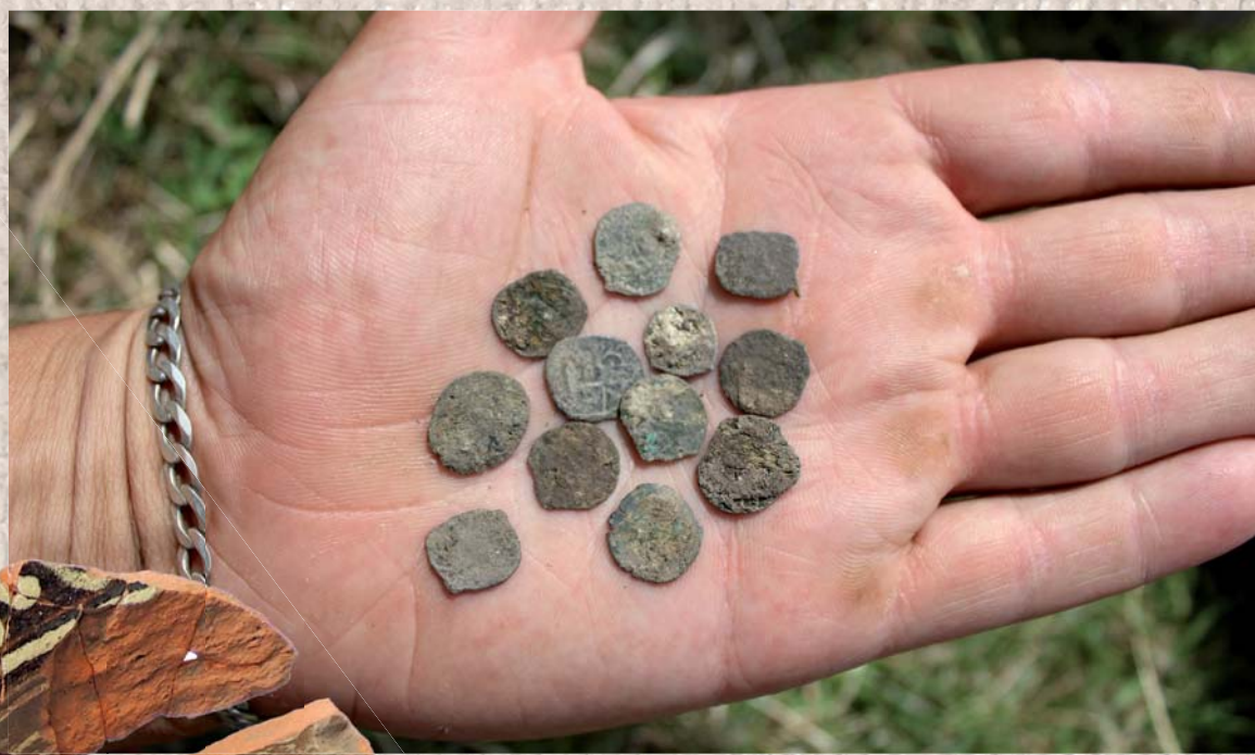
Quartíngy Žigmunda Luxemburského Kwartály Zygmunt Luksemburskiego