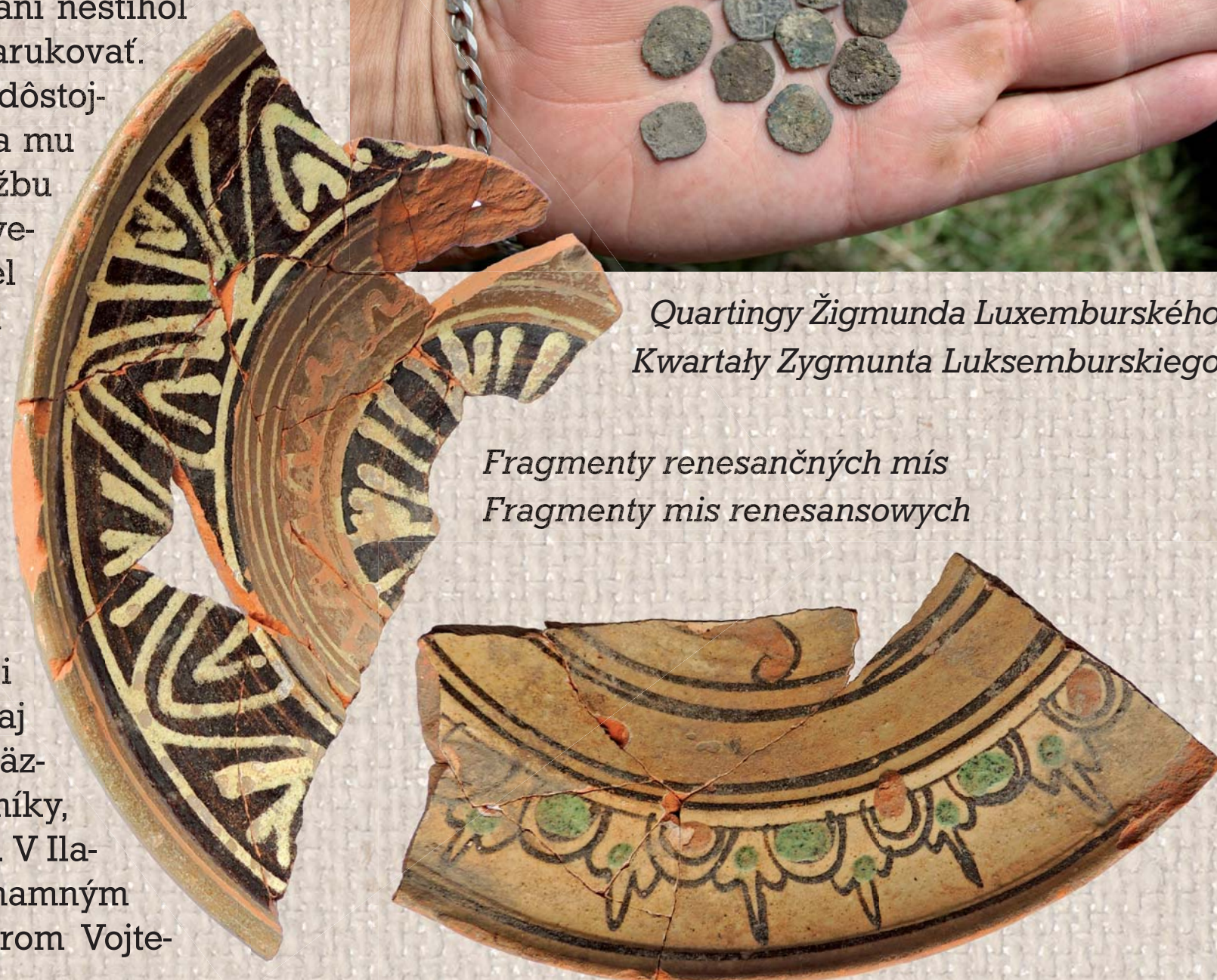
Fragmenty renesančných mís Fragmenty mis renesansowych